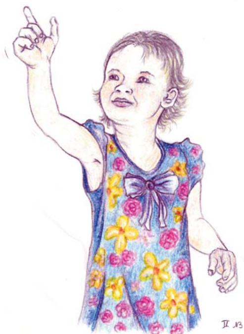
Disegno di Nicole Bretschneider

Un suréis luminous, beata giuvinéza, la burdèla la j è péina ad cuntantéza: «Par la su faméja la m'avrà scambiè?» A vréb lès una farfallina enca me».