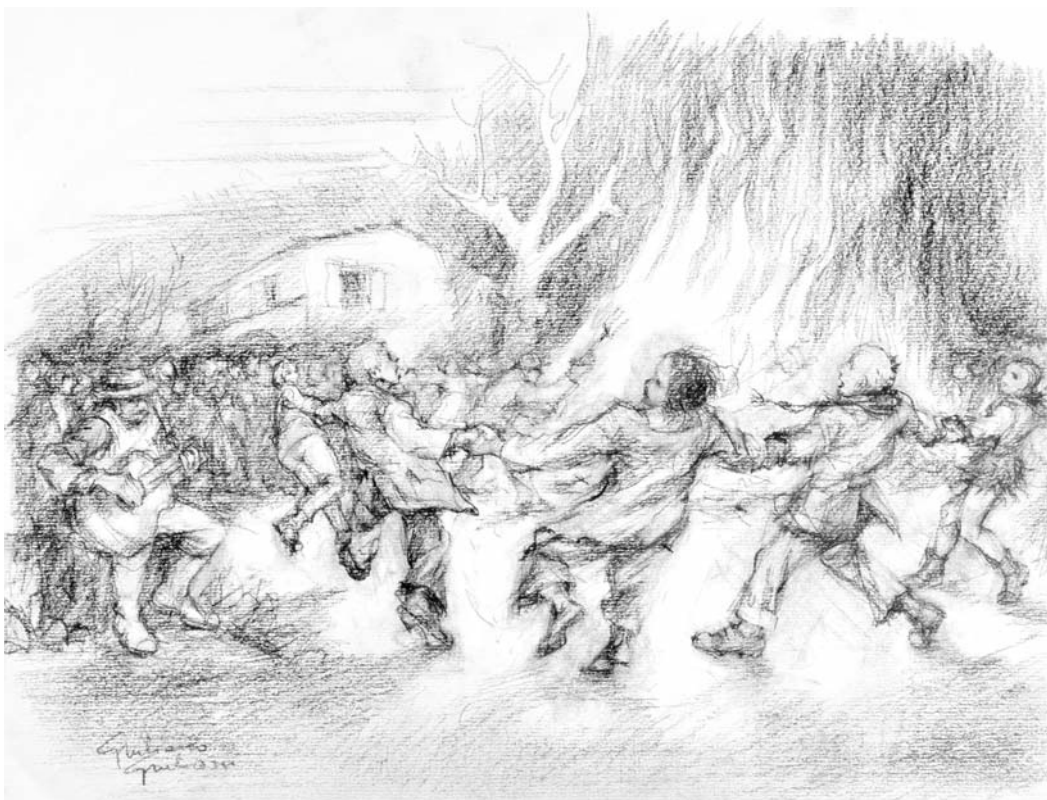
Disegno di Giuliano Giuliani

Quei lumi dei falò, nella campagna, / che illuminavano tutta la Romagna, / me li ricordo bene, sul finire di febbra- io / e nelle prime tre sere del mese di marzo; // lumi per cancellare il freddo e il buio dell'inverno / e per bruciare gli avanzi delle potature; / e tra i bambini che saltavano attorno ai fuochi / c'ero anch'io, a fare quei giochi. // Quei bei falò, ai giorni d'oggi, / sono passati di moda, non usano più: / adesso ci sono il "Pici" e la "Tivù" // che hanno cambiato questo mondo (purtroppo lo so!) / e se abbiamo perso di quei lumi la tradizione, / che non perdia- mo pure il lume della ragione!