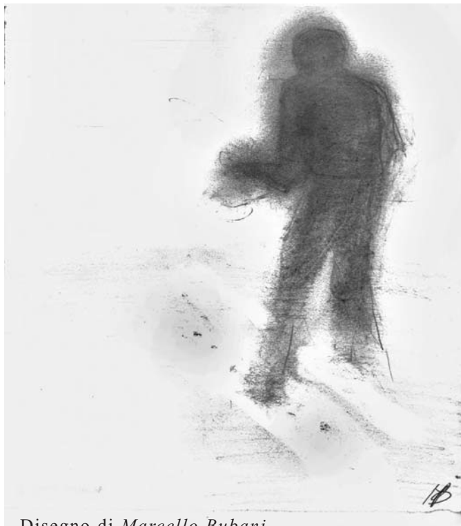
Disegno di Marcello Bubani

ch’ta t cirta incaminê int un viòl zig; e cvând che, smari, t at ci arvultê, t at cirta lasê indri sòl dal mulig.