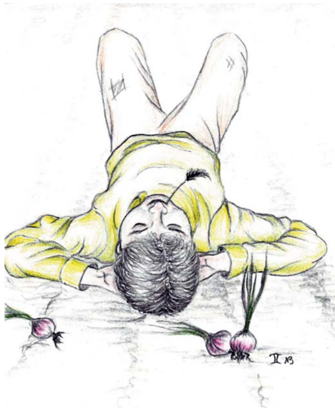
Disegno di Nicole Bretschneider

guerra / cresciuto con poche cipolle dalla terra / e gli altri giorni, latte di gallina. / Dopo il '60, prendeva la pensione / forse perciò non ha mai lavorato / prendeva il calore dal sole, / il fresco dal bosco, / il sale dal mare, e il mangiare dal rusco. / Anche al suo matrimonio, buona grazia, / fumava i pampini per risparmiare il tabacco. / S'è sposato a Comacchio, tra campanili e canaletti / "Costa meno, ma è uguale a Venezia". / Una notte ha preso fuoco / un sole basso nella campagna / casa sua bruciava come un ciocco di legna, / ha attirato più gente della fiera di Lugo. / Al mattino cenere ovunque, una neve di cenere / niente corpi od oggetti, solo una fumaglia torbida. / Alla sua maniera, ha avuto ragione lui. / Non ha mai pagato il funerale.