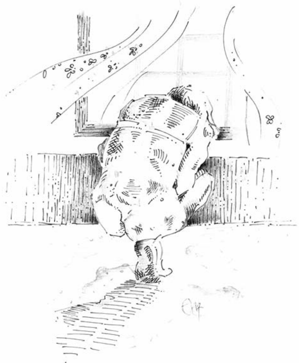
Disegno di Claudia Mazzoni

U s aslonga la fila, un êtar nom. La mimosa la fa e fiè, la s'è impasida, Quāti paròl ch'al vola, te met di cunfei, dōna, smetla d cuntitèt, fat rispetè, smota zò da cla giostra maladeta, da la cundāna d resar sèmpar bēla, zovna, suridēta, a l'alteza dla situazō. Brisa ardūsart un scartoz int un cantō. Mo al paròl al perd e color, al s asversa. Al s fa in là, giazēdi, la fila la s aslonga. Na mā asasēna l à ciap la rānda. Incora. E me dneiz a un armèri pì balunè a pēs ch'a n ò gnit da mètum, a so nuda, sēza un straz d dignitè, cverta d veit.