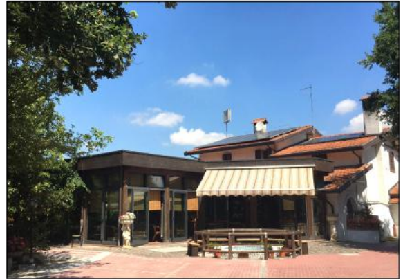
Ristorante da Dany a Savio di Ravenna

Per coloro che non sanno come raggiungere il ristorante, ritrovo alle ore 10.30 presso la nostra sede. La Schürr declina ogni responsabilità per eventuali danni in itinere o durante la manifestazione.