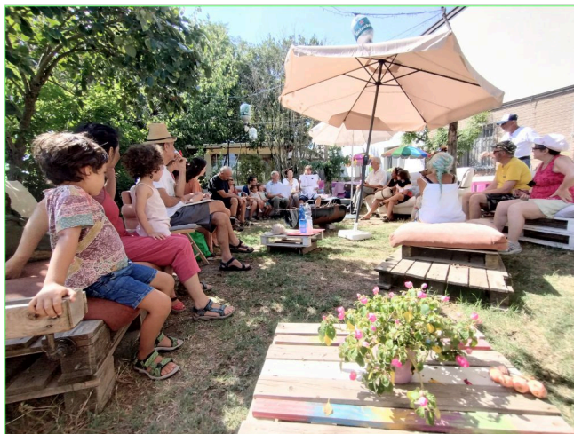
Il numeroso pubblico presente